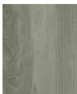
RENOLIT COVAREN Messina PC