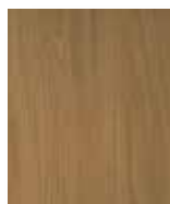
RENOLIT ALKOREN Lissa A