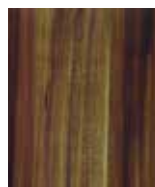
RENOLIT COVAREN Wallis Plum 2SC

* Les couleurs présentées sur ce document ne sont pas contractuelles, elles peuvent présenter des différences par rapport à la réalité.