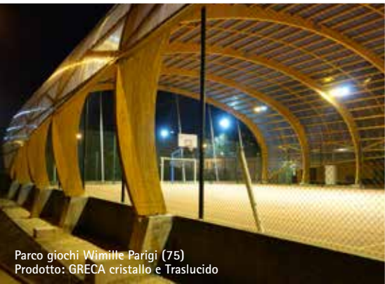
Parco giochi Wimille Parigi (75) Prodotto: GRECA cristallo e Traslucido