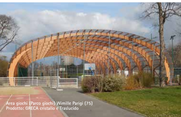
Area giochi (Parco giochi) Wimille Parigi (75) Prodotto: GRECA cristallo e Traslucido