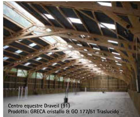
Centro equestre Draveil (91) Prodotto: GRECA cristallo & GTO 177/51 Traslucido