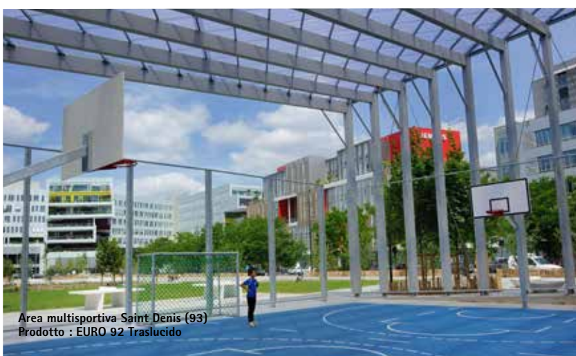
Area multisportiva Saint Denis (93) Prodotto : EURO 92 Traslucido