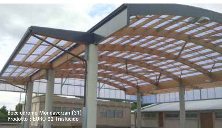
Bocciodromo Mondaverzan (31) Prodotto : EURO 92 Traslucido