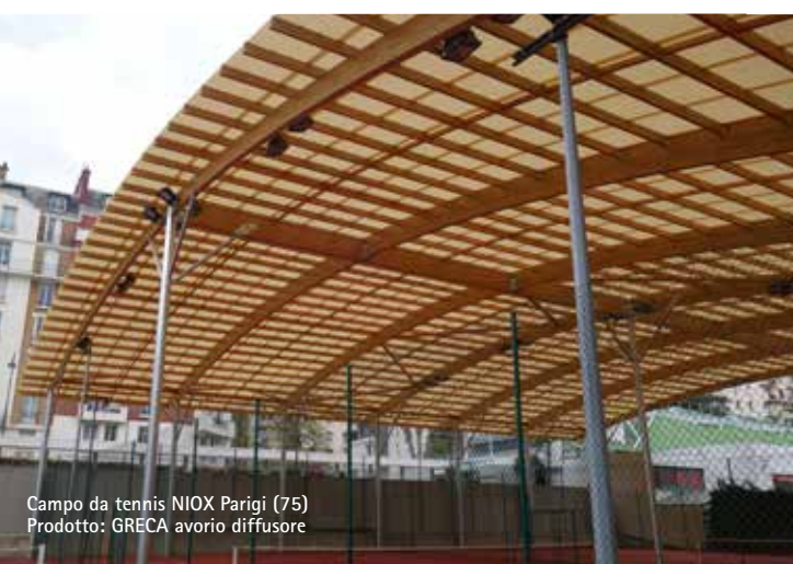
Campo da tennis NIOX Parigi (75) Prodotto: GRECA avorio diffusore