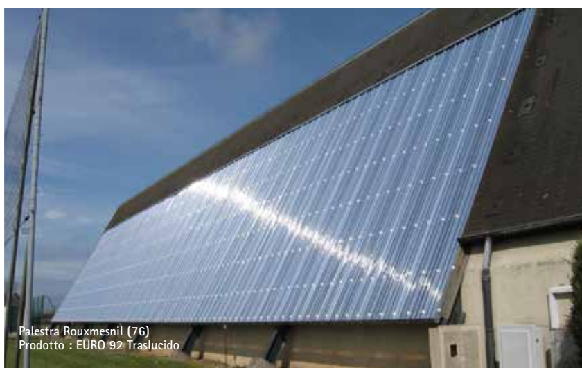
Palestra Rouxmesnil (76) Prodotto : EURO 92 Traslucido

Campi da tennis coperti • Bocciodromi • Stadi • Palestre • Maneggi • Complessi multisportivi • Area giochi (Parco giochi) • Tribune