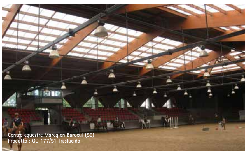
Centro equestre Marcq en Baroeul (59) Prodotto : GO 177/51 Traslucido