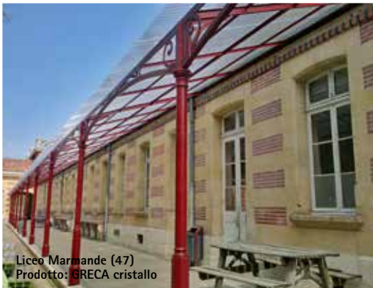
Liceo Marmande (47) Prodotto: GRECA cristallo