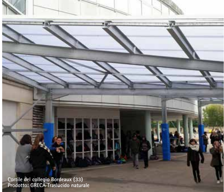
Cortile del collegio Bordeaux (33) Prodotto: GRECA-Traslucido naturale