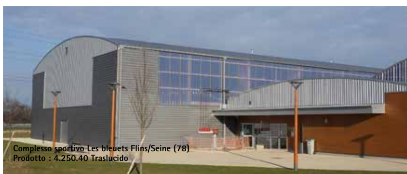
Complesso sportivo Les bleuets Flins/Seine (78) Prodotto : 4.250.40 Traslucido