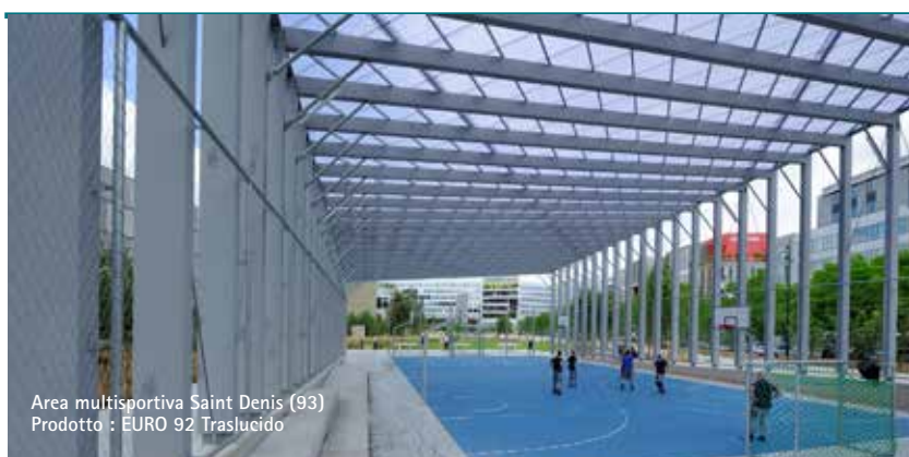
Area multisportiva Saint Denis (93) Prodotto : EURO 92 Traslucido