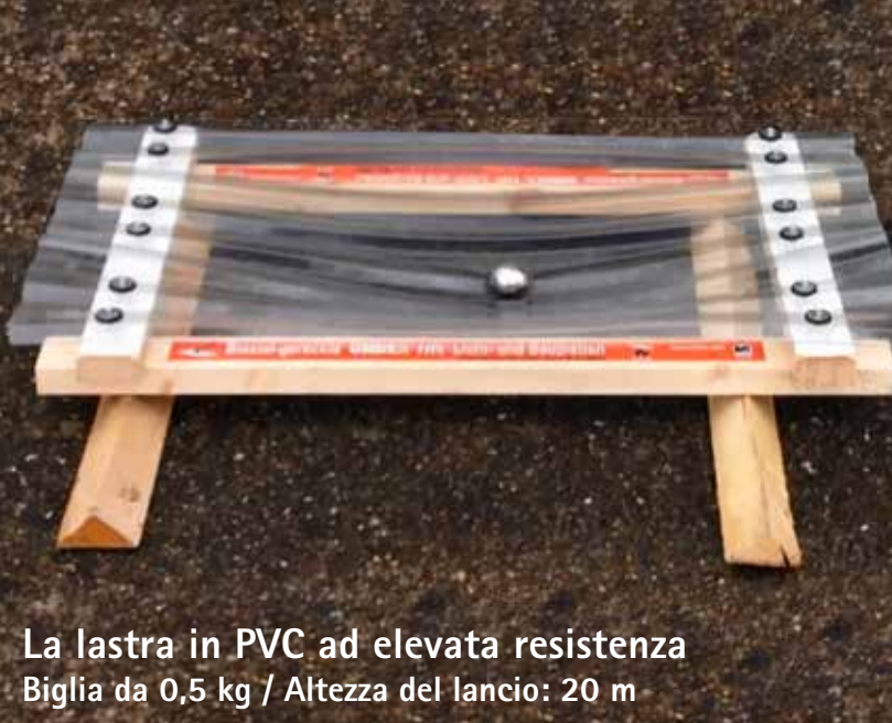
La lastra in PVC ad elevata resistenza Biglia da 0,5 kg / Altezza del lancio: 20 m