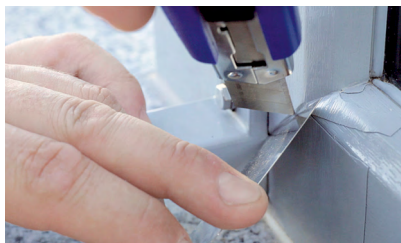
6. Finition des chants

Tout savoir sur la rénovation des films : devenez rapidement spécialiste en réparation grâce à la formation par des experts RENOLIT .