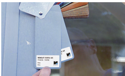
1. Livellamento della pellicola

Dopo un corso di formazione di RENOLIT è possibile riparare i danni ai profili rivestiti con pellicole alla stessa velocità con cui sono stati provocati.